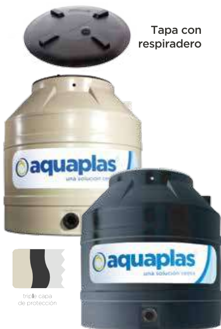
Tapa con respiradero